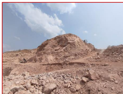
หน้าเหมืองปัจจุบันของโครงการ