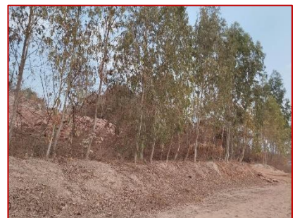
แนวเว้นการทำเหมือง